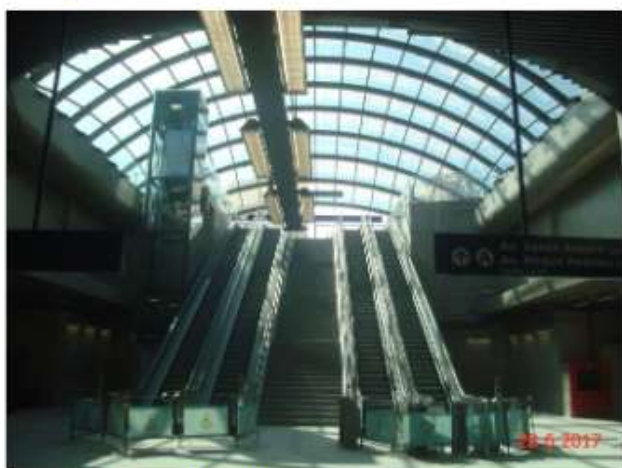
Acesso Principal: Comunicação visual instalada