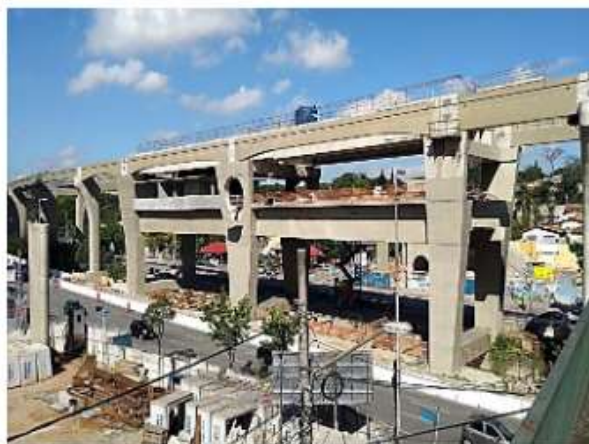
Corpo da Estação.