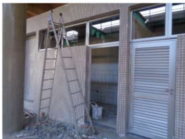
Acabamento das Salas Operacionais SPTrans.