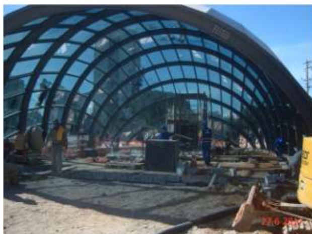
Acesso Principal: Instalação do vidro