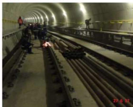
Trecho Estacionamento de trens Servidor – AACD-Servidor: Esmerilhamento das soldas.