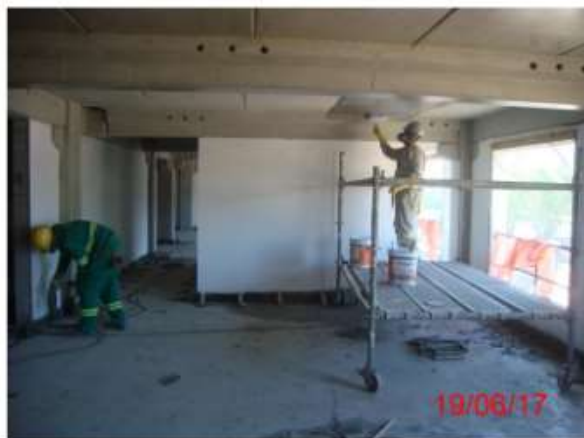
Porão de cabos das salas técnicas: tratamento de concreto e rodapé.