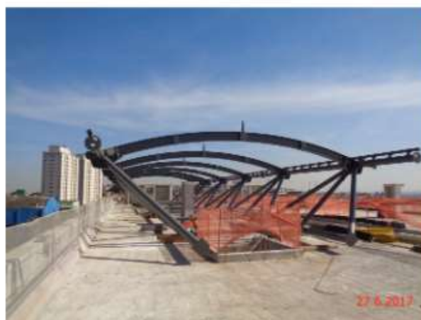
Montagem da cobertura metálica da Plataforma.