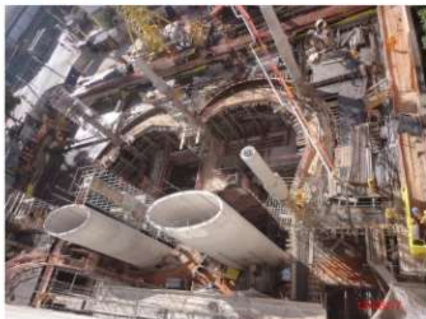
Acesso Sul: Execução das estruturas internas