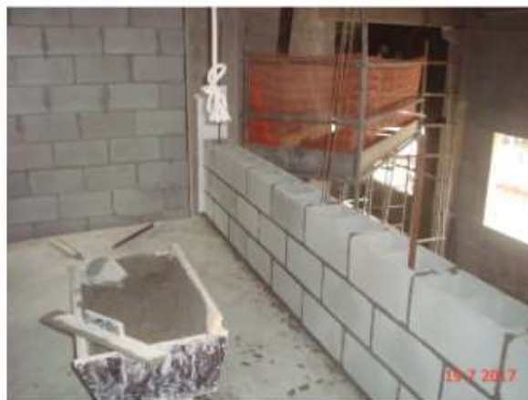
Edifício de salas técnicas: alvenaria.