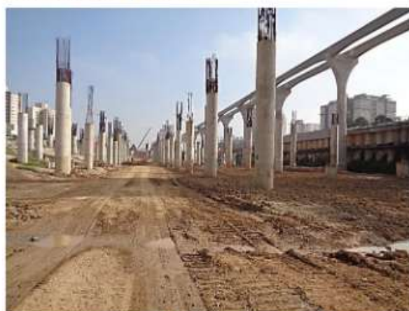
Pátio Água Espraiada – Execução de terraplenagem.