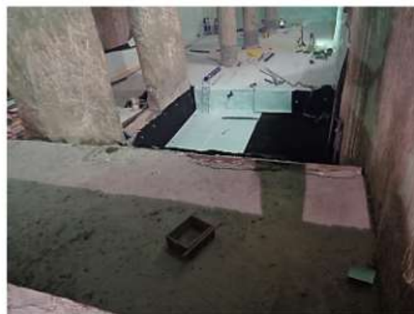
Impermeabilização do acesso de interligação com a Linha 5.