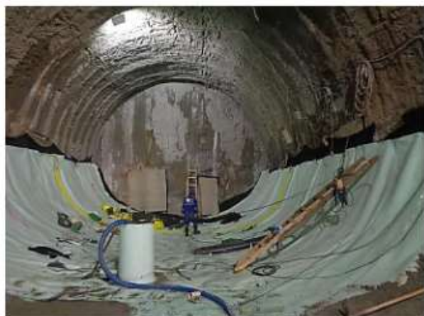
Execução do túnel de acesso ao Aeroporto.