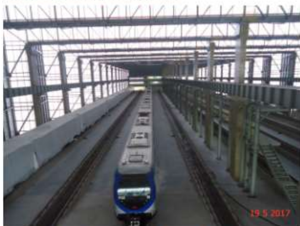
Trens CAF estacionados no Bloco A do Pátio Guido Calóí