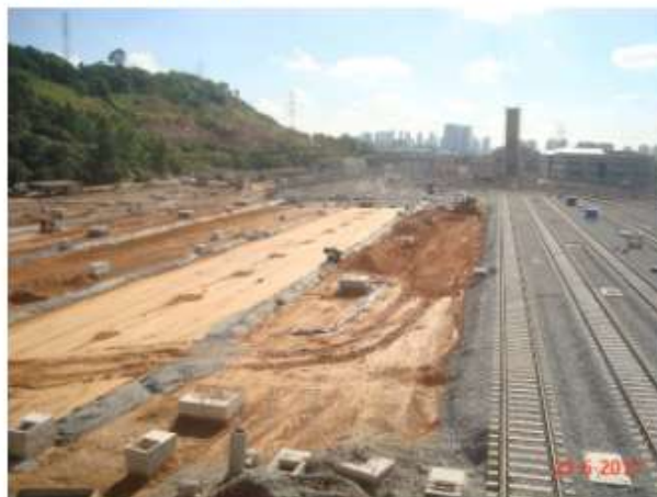
Via Permanente: Terraplenagem para disposição do anticontaminante.