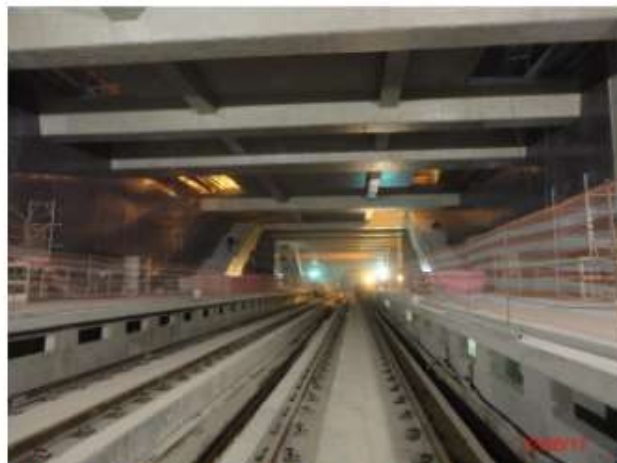
Nível plataformas: Vista geral das plataformas e via