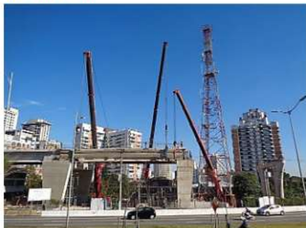
Lançamento de vigas-guia.