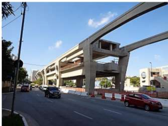
Vista do corpo da Estação.