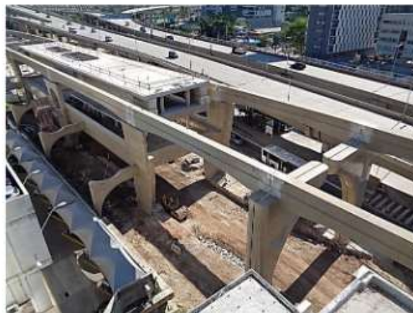
Corpo da Estação