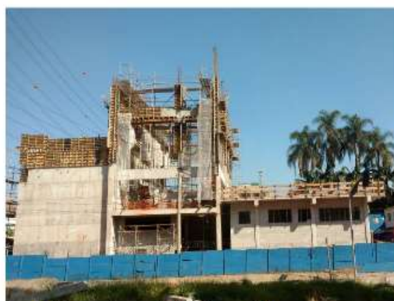
Execução da Obra Civil da Subestação.