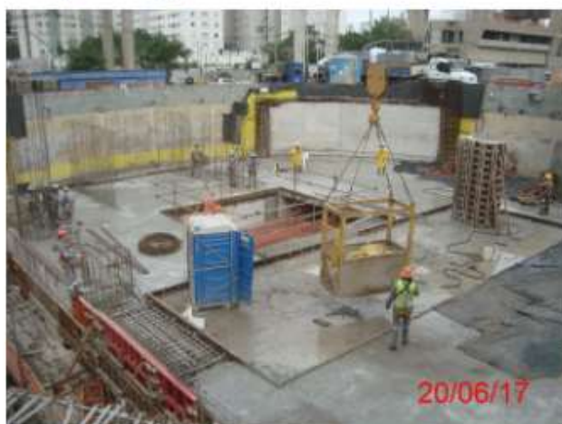
Corpo da estação: Estruturas internas – Poço 1