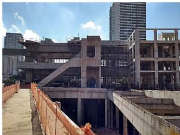
Corpo da Estação.