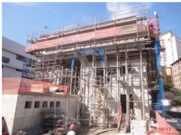
Execução da torre de ventilação e saída de emergência