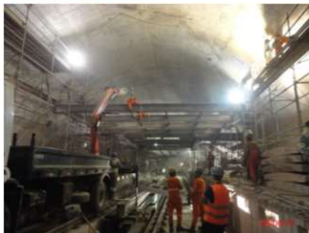
Corpo da estação: Montagem do mezanino metálico