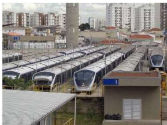
Trens em testes no Pátio Oratório.