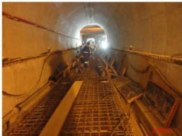
Túnel de estacionamento Via 2: Execução da via permanente