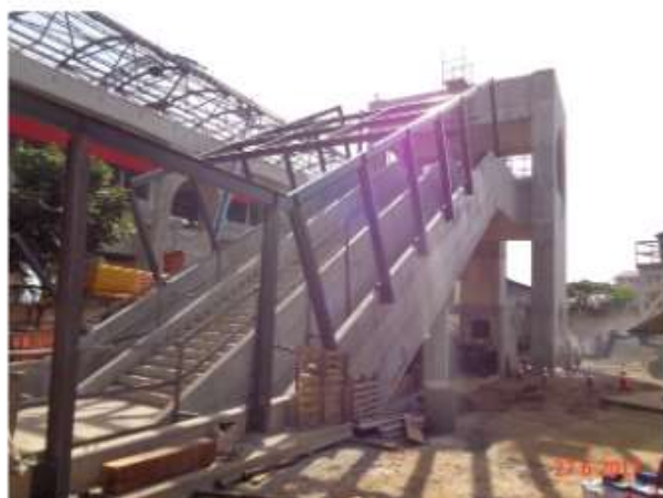
Instalação da cobertura metálica da Plataforma e do Acesso Sul.