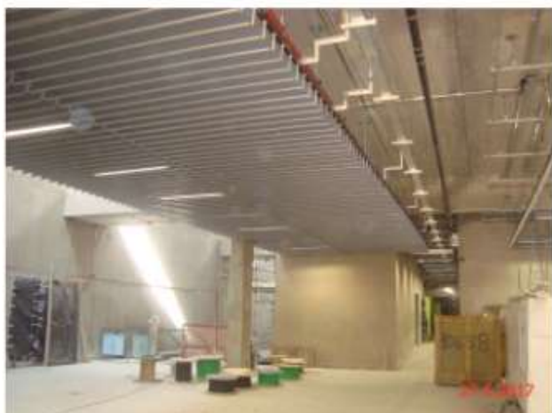
Mezanino Superior: Instalação do forro