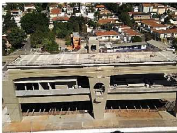
Corpo da Estação.